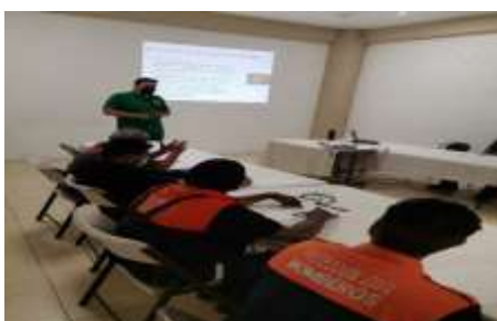
Fig. 3- Cursos básicos impartidos a los municipios de Mascota, Guachinango y Puerto Vallarta por personal de la JISOC y SEMADET de brigadas regionales de la Sierra Occidental.