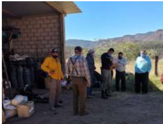
Fig.7- Actividades de validación de brigadas ejidales en el municipio de Mixtlán Jalisco.

En cuanto a las necesidades propias de la infraestructura y coordinación de la región operativa, se ha dado seguimiento a la actualización de las comunicaciones en las torres vigías para incendios forestales. se realizó un análisis de necesidades de las torres para frecuencia y comunicar las regiones del estado por el uso de estas mismas estructuras como bases para repetidoras. Las torres vigías actualizadas y bajo servicio son: