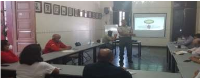
Fig.4- Actividades durante la capacitación a integrantes de la mesa técnica del Fuego de la Sierra Occidental orientadas a la implementación del SCI por personal de protección civil y bomberos de Jalisco.