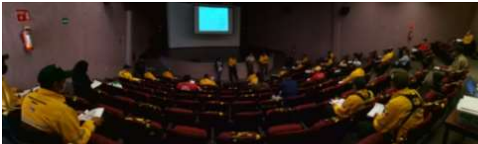
Fig. 1.- Actividades dentro del Curso SCI 100-200 en el auditorio Municipal de Talpa de Allende Jalisco.