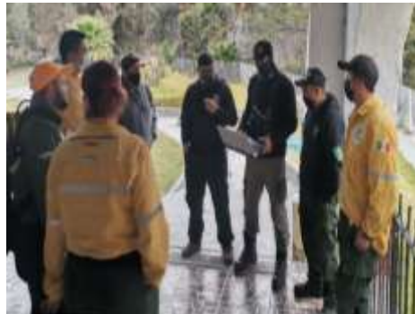
Fig.5- Actividades desarrolladas durante la capacitación de primeros auxilios enfocados a unidad de respuesta a emergencias forestales en las instalaciones del centro de capacitación Agua Brava, impartido por personal de Bomberos Zapopan y CONAFOR