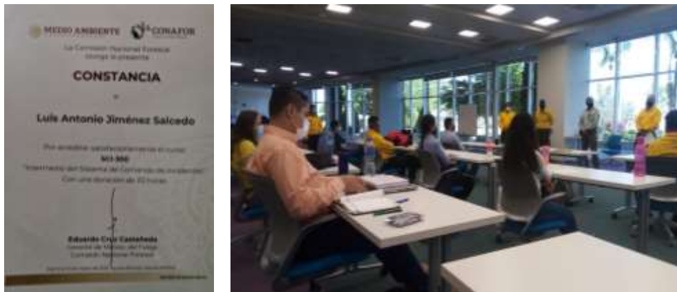
Fig. 2- Curso intermedio del Sistema de Comando de Incidentes SCI 300 en la ciudad de Aguascalientes impartido por personal de CONAFOR.

Como parte de la capacitación integral de la coordinación de manejo de Fuego de la Junta intermunicipal y como seguimiento a los cursos anteriores del sistema de comando de Incidentes, se asistió al curso intermedio del sistema de comando de Incidentes SCI 300. Esta capacitación fortalece la organización fundamental para la atención de incidentes en expansión de manera efectiva. Esta capacitación se llevó a cabo en la ciudad de Aguascalientes con una duración de tres días.