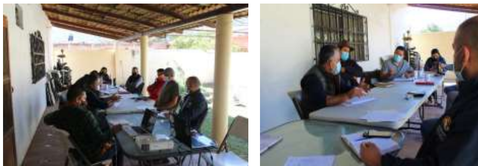
Fig.13 - Desarrollo de sesión de la Mesa técnica de fuego en la región sierra occidental

Desde su creación en noviembre del 2020 hasta la fecha, esta mesa ha tocado temas de análisis como el programa regional de manejo de fuego, cultura de manejo de fuego, información legal, difusión de norma, revisión de material didáctico para las distintas acciones de difusión, así como organización de acciones operativas complementarias para la ejecución de sección operativa en toda la región.