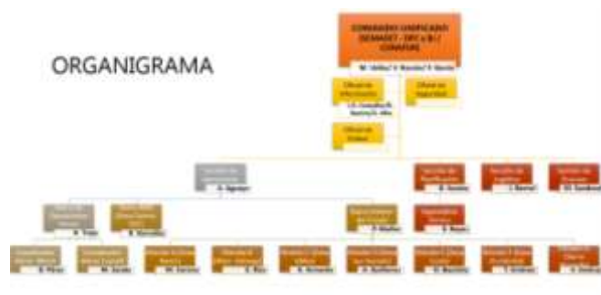
Fig.8- Organigrama del sistema de comando de incidentes para el Operativo de semana santa en el estado.

Con el objetivo de atender de manera coordinada la problemática de incendios forestales en el territorio del estado, se participó en el Operativo de semana santa y pascua, con la adición del operativo regional de semana santa ruta del peregrino correspondiente a la División F.