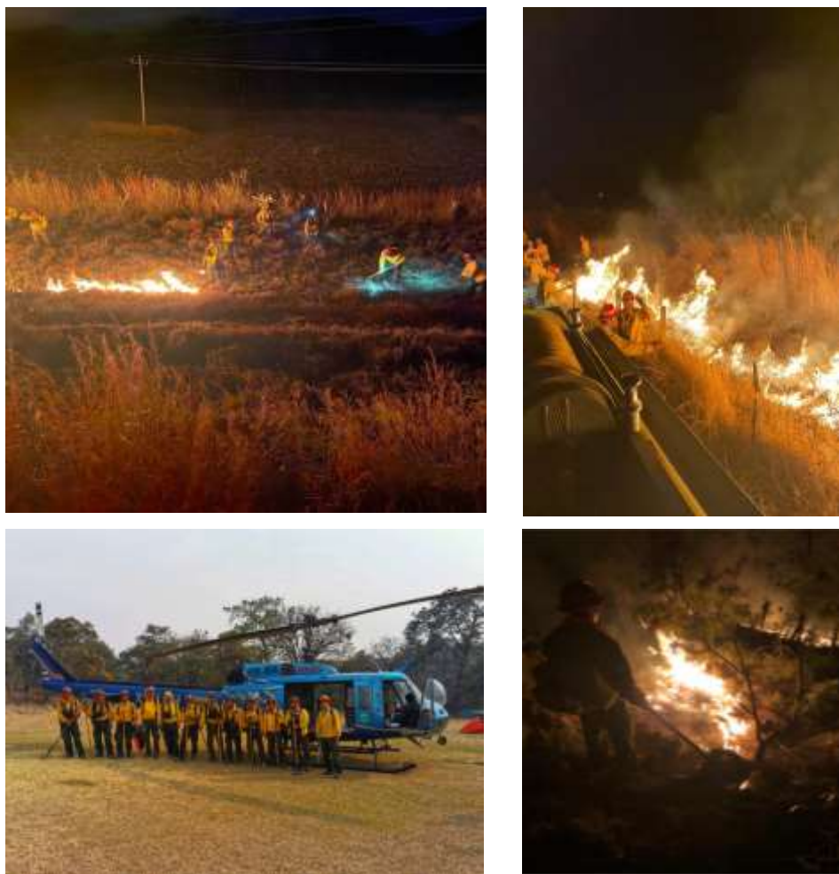
Fig. 6- Actividades de prevención, manejo de combustibles, así como control y combate de incendios forestales en la región sierra Occidental y Costa.

La temporada de incendios forestales para la región sierra occidental en el primer trimestre del 2021 a comparación del 2020 denota con mayor actividad, reflejo de la situación actual del estado. Para el territorio de la JISOC se han registrado en total 35 incendios de los cuales 18 fueron de carácter forestal y aportaron 1198.17 hectáreas afectadas, mientras que los incendios de vegetación pastizal natural o inducido fueron 17 y con afectación de 67.27 hectáreas, dando un total de afectación en el primer trimestre del año de 1265.44 hectáreas totales siniestradas por incendios.