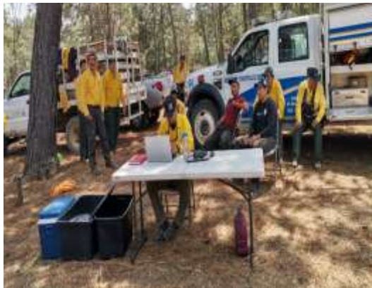
Fig.11.- Centro de mando instalado durante la ejecución del operativo Semana Santa.